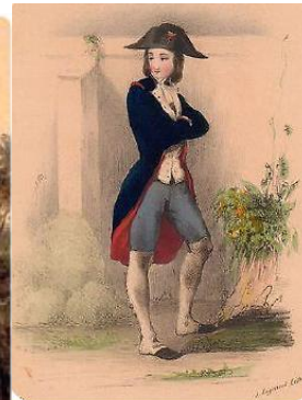
Un lycée sous Napoléon I er